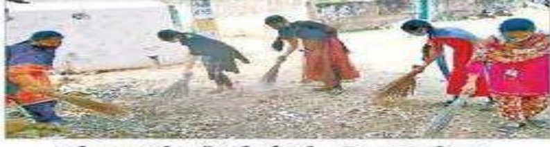
వ్యర్థాలను ఉడుస్తున్న విద్యార్థినులు