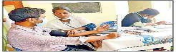
వైద్య పరీక్షలు నిర్వహిస్తున్న సిబ్బంది