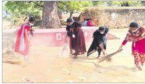
కలటూరులో స్వచ్ఛ భారత్ కార్యక్రమంలో పాల్గొన్న ఎన్ఎస్ఎస్ విద్యార్థులు