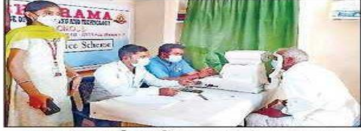
గ్రామస్థులకు నేత్ర పరీక్షలు నిర్వహిస్తున్న సిబ్బంది