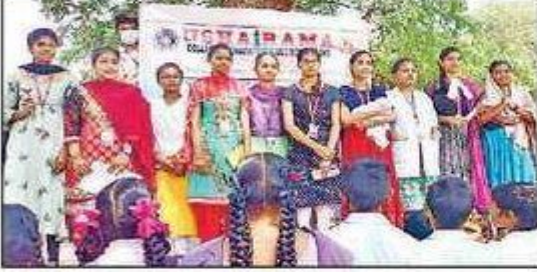
గ్రామంలో ప్రదర్శన నిర్వహిస్తున్న ఎన్ఎస్ఎస్ విద్యార్థులు