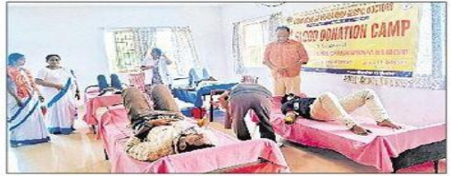
రక్తదానం చేస్తున్న విద్యార్థులు